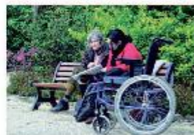
Aide aux personnes à mobilité réduite