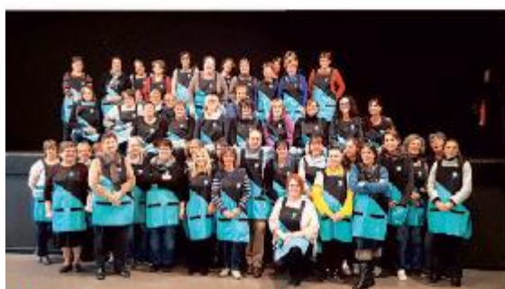
Une de nos équipes prête à vous accueillir

Déductions fiscales et crédits d'impôts selon la législation en vigueur