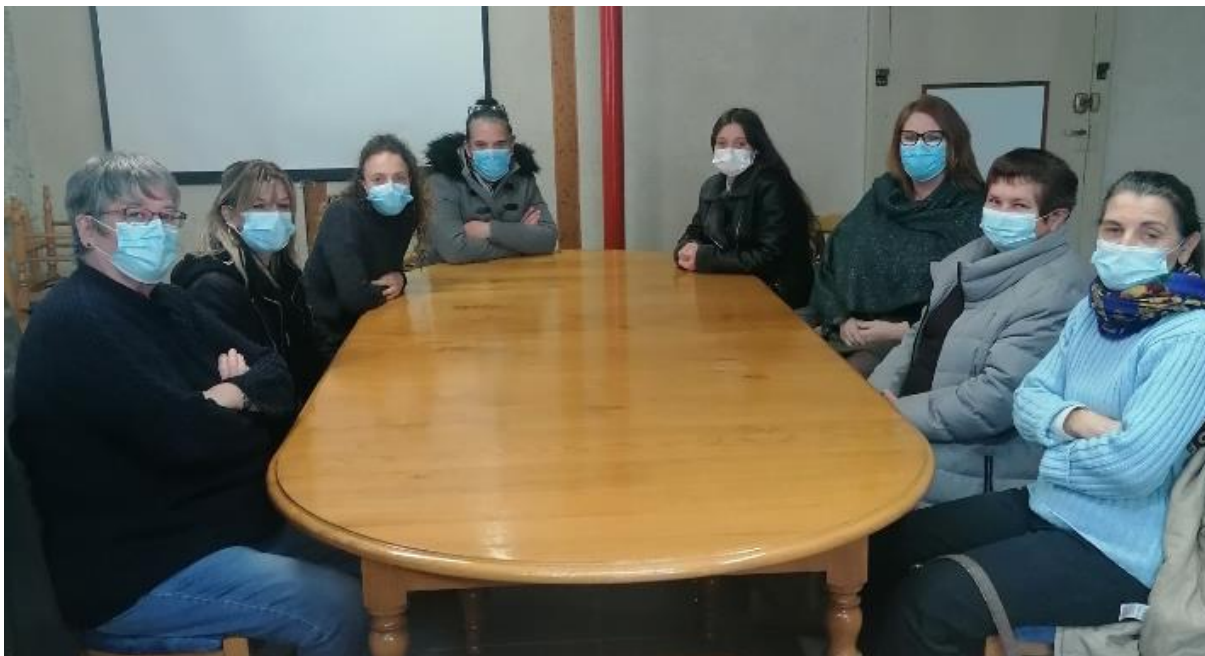
Voici une partie de l'équipe de Caussade !