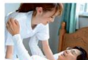
Service de soins infirmiers à domicile