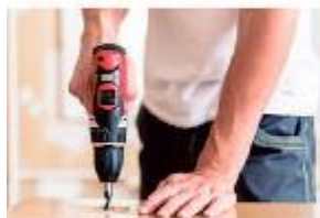
Petits dépannages Bricolage