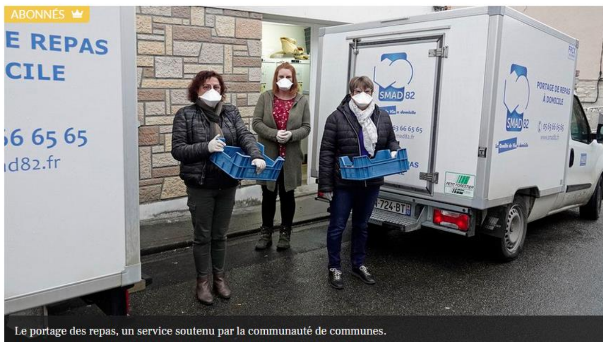
Le portage des repas, un service soutenu par la communauté de communes.