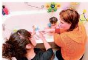
Aide aux Mères de Familles