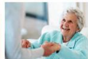
Equipe Spécialisée Alzheimer